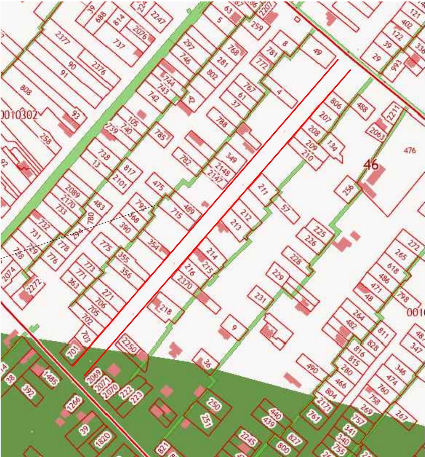
Охранная зона инженерных коммуникаций

В соответствии с ПЗЗ, утвержденным проектируемая территория расположена в зоне с особыми условиями использования территории, а именно в границах приаэродромных территорий "Аэродром экспериментальной авиации Ростов-на-Дону «Северный» (Решение об установлении приаэродромной территории аэродрома экспериментальной авиации, город Батайск" ( см. Воздушный кодекс РФ, постановление Правительства Российской Федерации №138 "Об утверждении Федеральных правил использования воздушного пространства Российской Федерации").