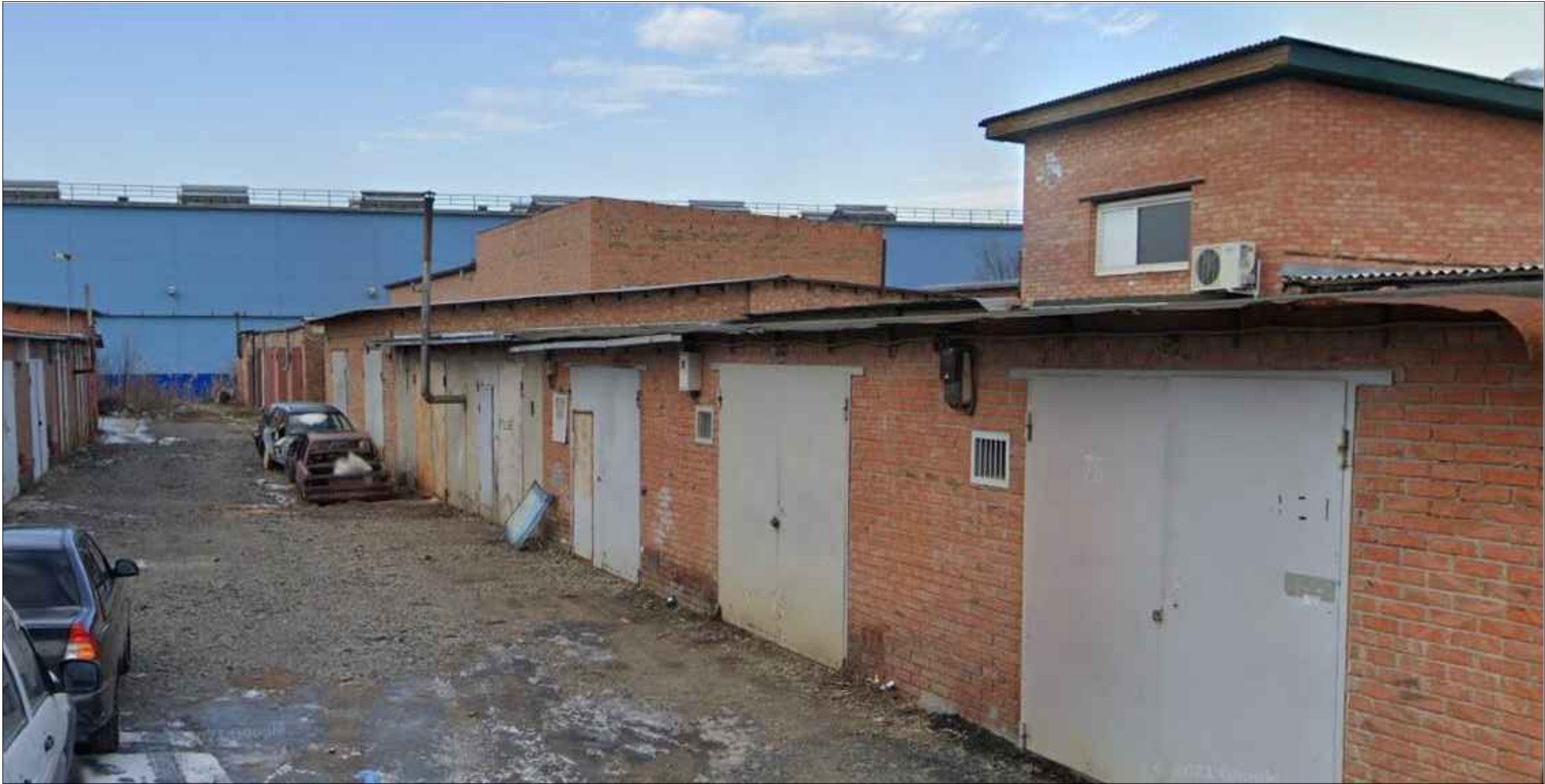
Схема планировочной организации земельного участка разработана в масштабе 1:200 на топографической основе. Система высот Балтийская. Система координат МСК-61. Земельный участок расположен в пределах городских земель, в центральной части города, в условиях сложившейся застройки. Участок расположен по улице Ушинского, рядом с гаражным кооперативом. Проектом предусмотрены следующие мероприятия: - устройство проездов и парковок на участке. Система отвода поверхностных вод - открытая, по спланированной территории в проектируемый дренажный колодец на участке.